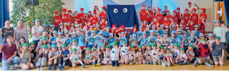
Ferie deheim-Woche in Strengelbach