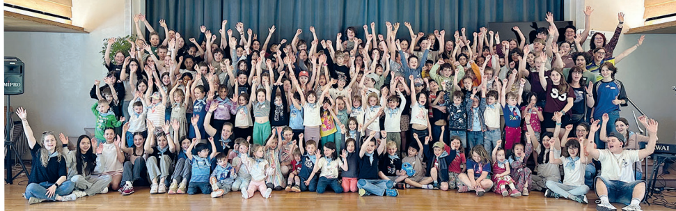
Ferie deheim-Woche in Zofingen