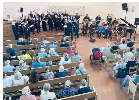
Musical «Hoffnung in tiefster Nacht» Strengelbach